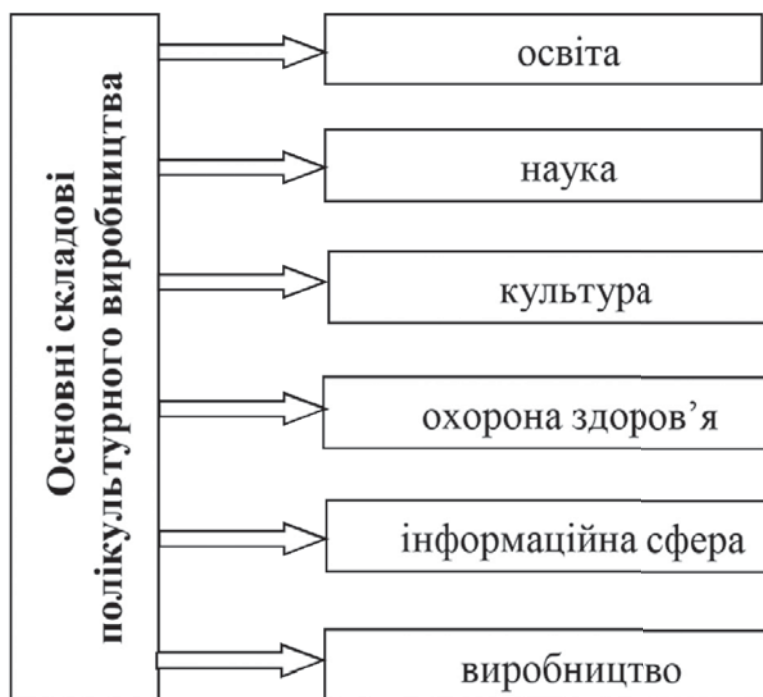
Рис. 2. Взаємозв'язок категорій полікультурної діяльності

– розвиток полікультурного середовища, що передбачає свободу культурного самовизначення майбутнього спеціаліста та збагачення його особистості тощо.