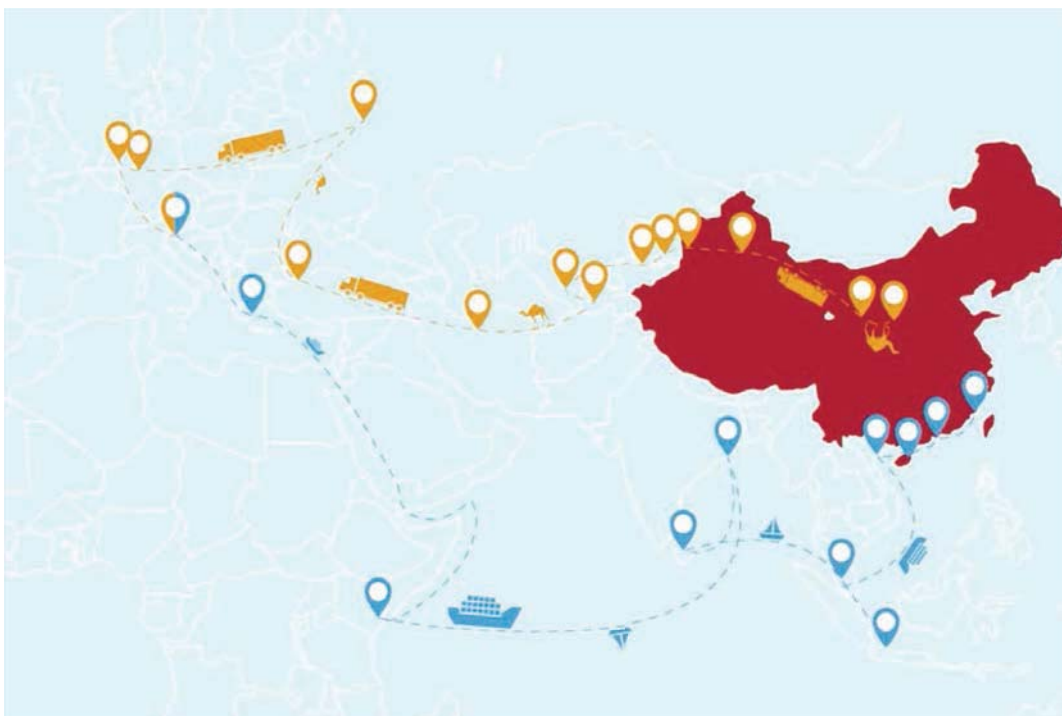
Рис. 1. Великий шовковий шлях. Китайська ініціатива «Новий шовковий шлях»

Найбільш вражаючі зміни відбуваються в китайській дипломатії у Східній Азії. Китай розширює й підсилює свої двосторонні відносини, бере активну участь у багатосторонніх процесах та приймає не тільки активну, але й конструктивну участь у регіональних організаціях. За останнє десятиліття Китай суттєво змінив своє спочатку обережне ставлення до деяких організацій,