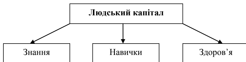
Рис. 1. Основні складники людського капіталу

Важливим показником бідності є й частка сімейного бюджету, що витрачається на харчування. У США та Японії ця частка становить третину сімейного бюджету, тоді як в Україні – понад 50%.