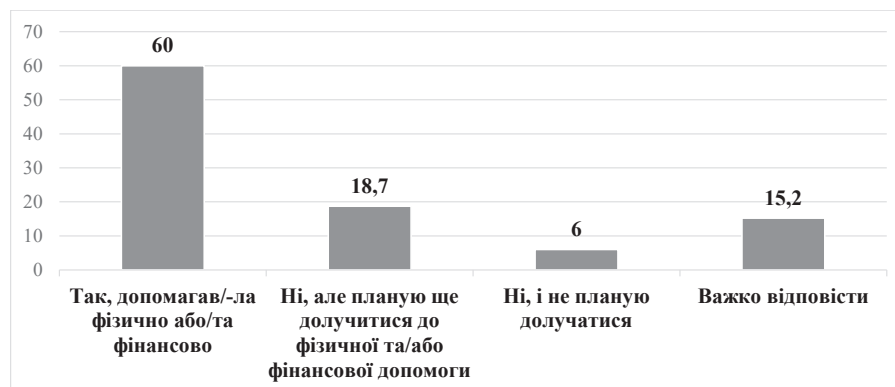
Рис. 3. Рівень залучення студентів до волонтерської допомоги армії/ТрО/іншим тимчасово переміщеним особам

Відповіді респондентів на запитання: «Чи залучені Ви до волонтерської допомоги армії/ТрО/іншим тимчасово переміщеним особам?», %