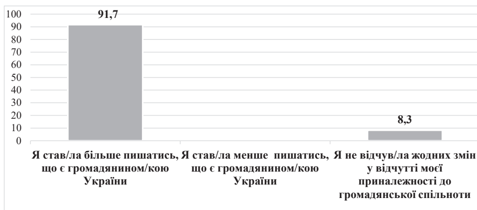
Рис. 1. Вплив війни на формування громадянської ідентичності

Відповіді респондентів на запитання: «Чи вплинула війна на формування Вашої громадянської ідентичності?», %